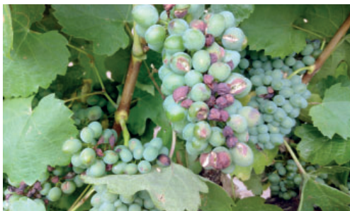
Hagelschäden können die Erntemenge und Weinqualität erheblich reduzieren.

Dieser Versuch wurde von Itacyl im Rahmen des Freshwines-Projektes unter der Leitung von Lallemand Önologie durchgeführt, das vom CDTI mit Mitteln des EFRE (Europäischer Fond für regionale Entwicklung) finanziert wurde.