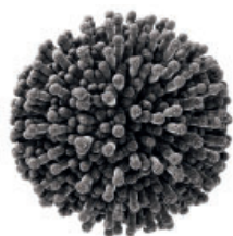
Chitosane provenant d' Aspergillus niger

Dans le graphique ci-dessus, résultat d'un essai réalisé à l'Université de Salamanque, nous avons observé l'effet de LalVigne BOTRYLESS™ sur le niveau d'inhibition de la croissance de différents isolats de Botrytis (sur boîtes de Pétri avec le milieu de culture MEA). Ce % d'inhibition, pour la plupart des isolats étudiés, est supérieur à 60 % et dans de nombreux cas, il dépasse 70 %. L'effet fongistatique est un des différents modes d'action de Botryless pour réduire la propagation du Botrytis dans les vignes.