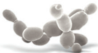
Levadura Saccharomyces cerevisiae (Grupo Lallemend)

En respuesta a los daños por granizo la vid tratará de contener la zona lesionada formando barreras físicas y químicas (Harris, 1992), ya que estas heridas suponen un nuevo espacio y nutrientes para insectos y patógenos. Los compuestos fenólicos serán parte importante de esta respuesta de la planta, por su actividad antioxidante y antifúngica así por su función como precursores de otros metabolitos secundarios como la lignina, componente fundamental de la pared celular de plantas. LaVigne CICATRIX estimulará la síntesis de estos compuestos facilitando una más rápida recomposición del área foliar para una recuperación del viñedo más rápida y efectiva.